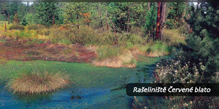
Rašeliniště Červené blato