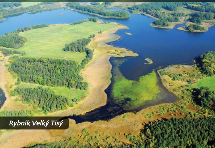
Rybník Velký Tisý