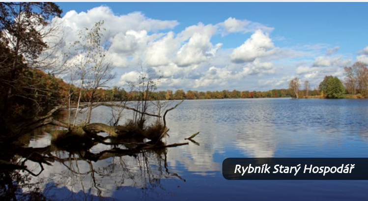
Rybník Starý Hospodář