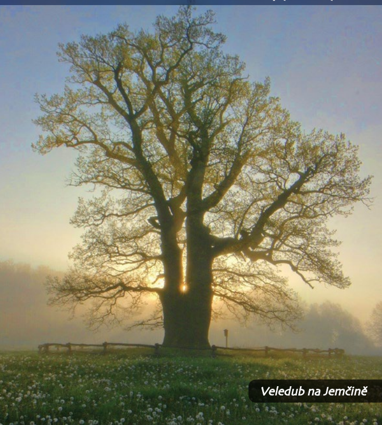
Veledub na Jemčině