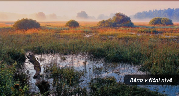
Ráno v říční nivě