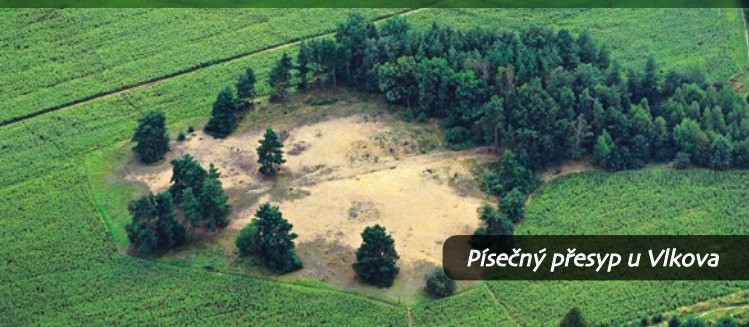
Písečný přesyp u Vlkova