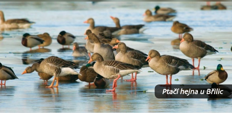
Ptačí hejna u Břilic