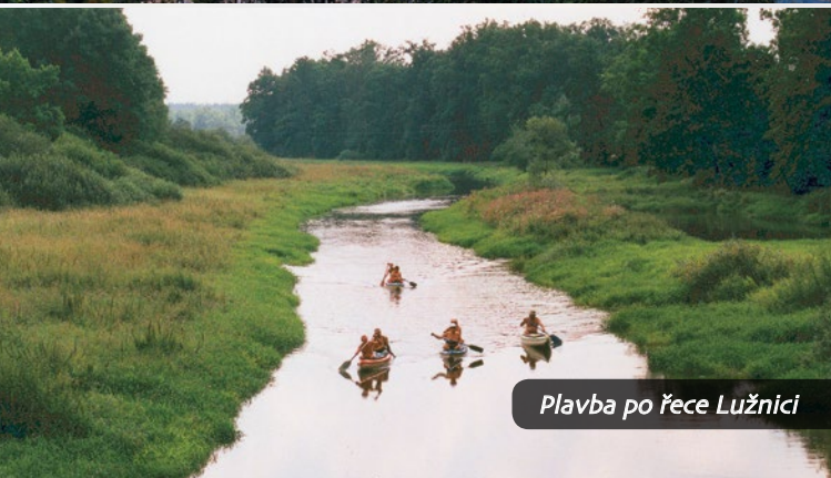
Plavba po řece Lužnici