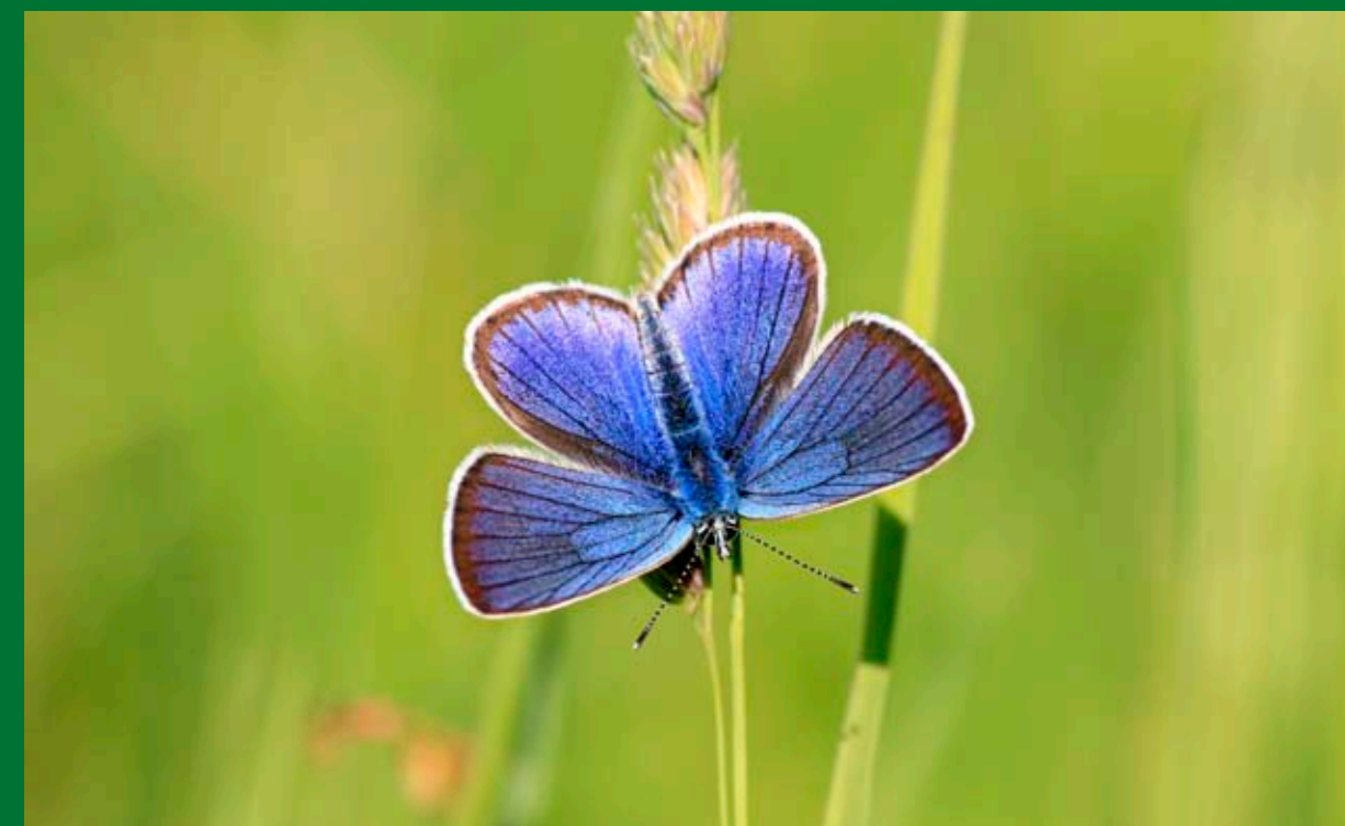
Modrásek lesní výrazně ustoupil z mnoha oblastí České republiky, v Jeseníkách je však pořád místy hojný. (foto Jan Ježek).