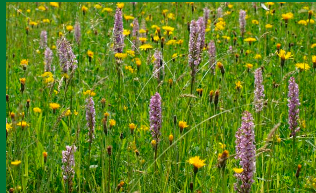
Pětiprstka žežulník je v celé ČR rychle ubývajícím druhem. Zde se stále vyskytuje v bohatých populacích.