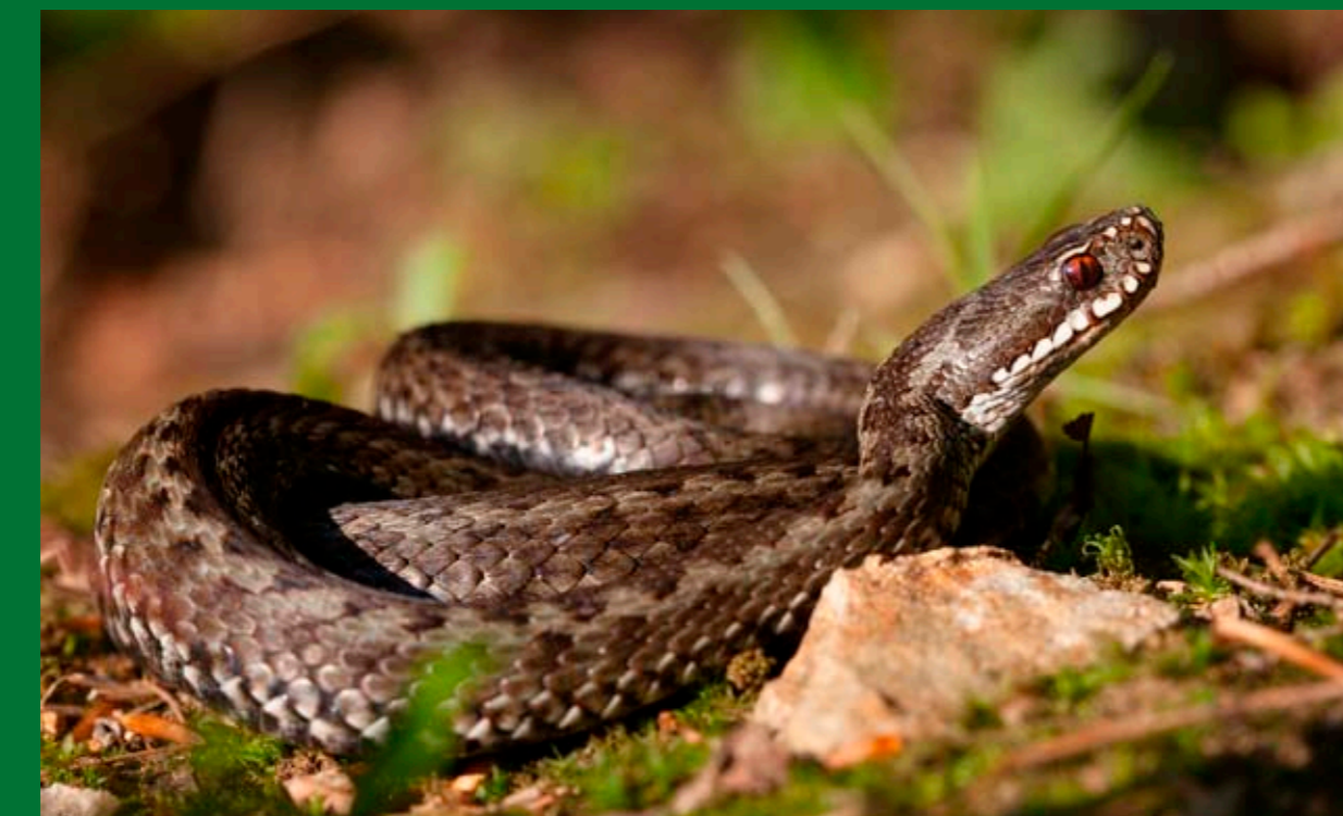
Na osluněných kamenicích můžeme zahlédnout zmijsku obecnou.