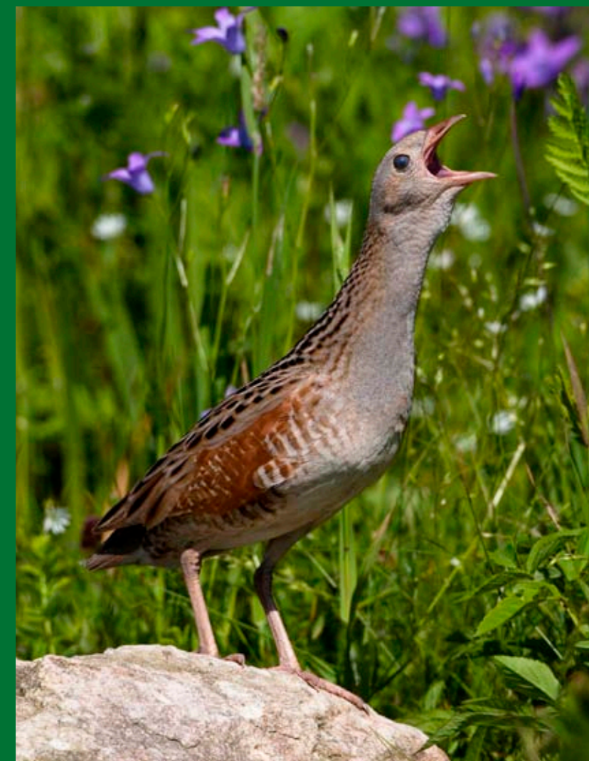
Později sečené vlhké louky jsou pro chřástala polního ideálním prostředím.