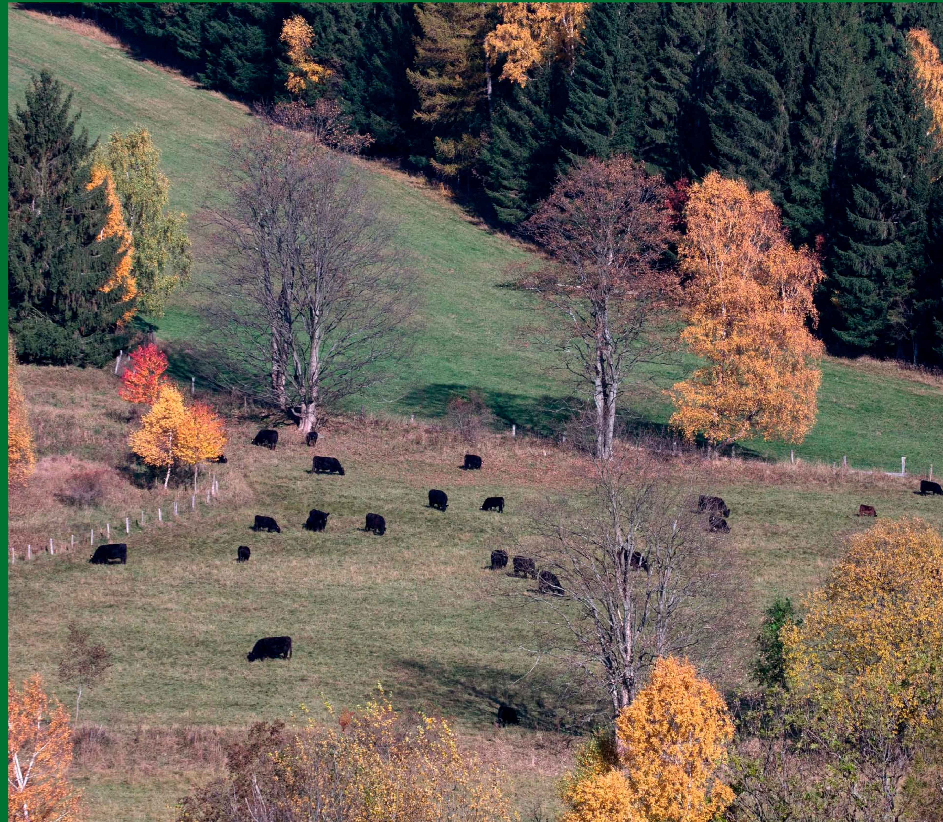
Pastva skotu pomáhá udržovat druhovou pestrost zdejších luk.