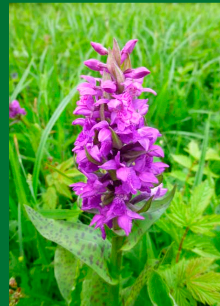
Prstnatec májový je druhem vlhkých luk.