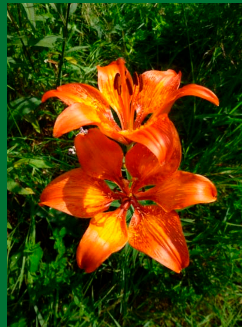
Na zdejších loukách se vzácně vyskytuje i lilie cibulkonosná.