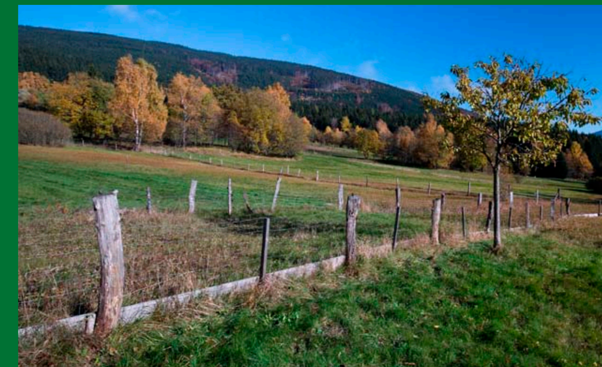
Nízké oplocení vybraných částí luk chrání orchideje před vyrýváním jejich hlíz divokými prasaty.